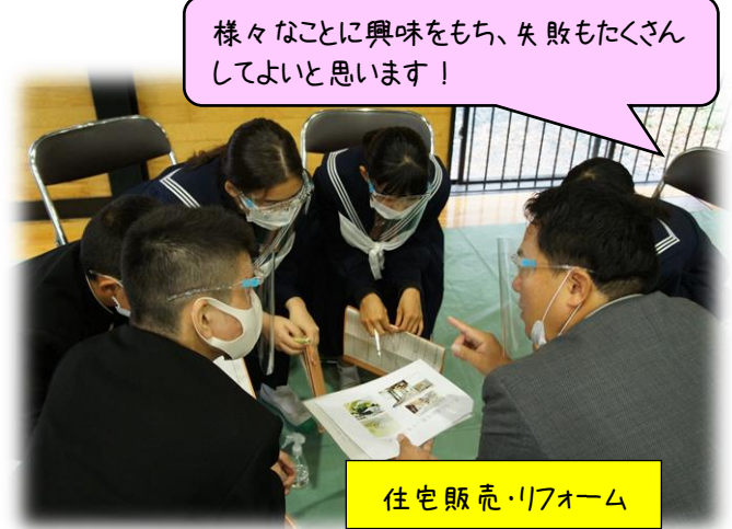
住宅販売・リフォーム

やりたいことは、なかなか見つからないと思います。あせらず、ゆっくり自分の仕事を探してください。