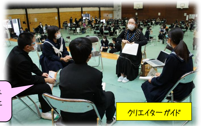
クリエイターガイド

自分自身を活かせる仕事「志事」は、喜びであり、生き方にもなります。みなさんの「志事」が見つかることを祈っています！